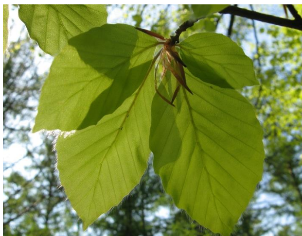
Jong blad van de beuk

Het is weer 15 maart geweest en volgens ons Verblijf- en Gebruiksreglement blz. 18 betekent dat het einde van de kapperperiode. Pas vanaf 1 september mogen de boomzagen weer uit het vet gehaald worden.